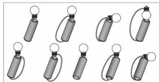
Montages avec une pile ronde et une ampoule.

7/ La maison ci-dessous présente de nombreux dangers liés à l'utilisation de l'électricité.