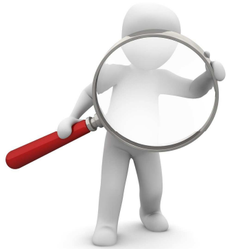
Situation de départ